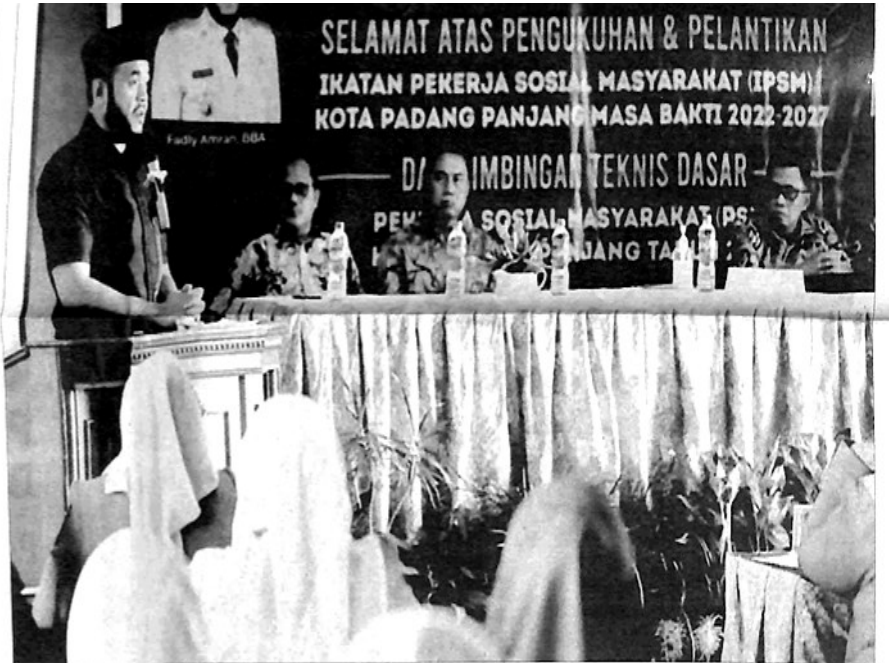
WALIKOTA Padangpanjang Fadly Amran saat mengukuhkan dan membuka Bimtek Dasar Pengurus IPSM Kota Padangpanjang.

"Salah satu cara beribadah kepada Allah, ialah laksanakan salat. Salat itu fungsinya sama dengan kepala. Tanpa kaki tanpa tangan, manusia masih bisa hidup, tetapi kalau tanpa kepala, manusia tidak bisa hidup," tutupnya. (ned)