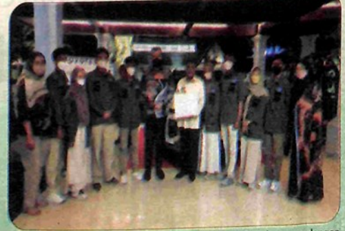
BERSAMA —Wali Kota Padang Panjang Fadly Amran Foto bersama dengan anggota Forum Anak Kota Padang Panjang