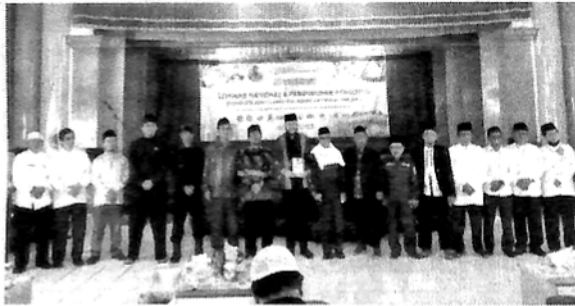
BERSAMA - Pengurus DDII Kota Padang Panjang yang baru foto bersama dengan Ketua DDII Pusat dan pejabat lainnya.