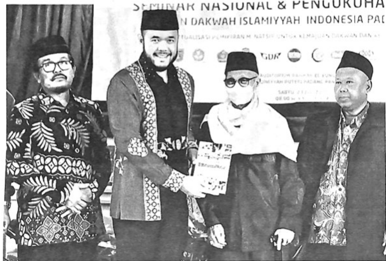
PENGURUS Dewan Dakwah Islamiyah Indonesia (DDII) Kota Padangpanjang resmi dikukuhkan.