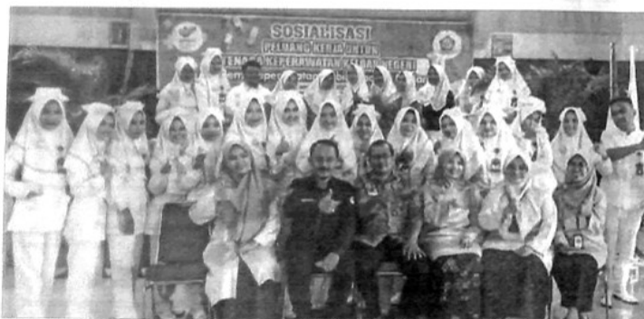
PESERTA Sosialisasi Peluang Kerja Keperawatan di Luar Negeri yang diikuti Mahasiswa AKPER Nabila Padangpanjang.