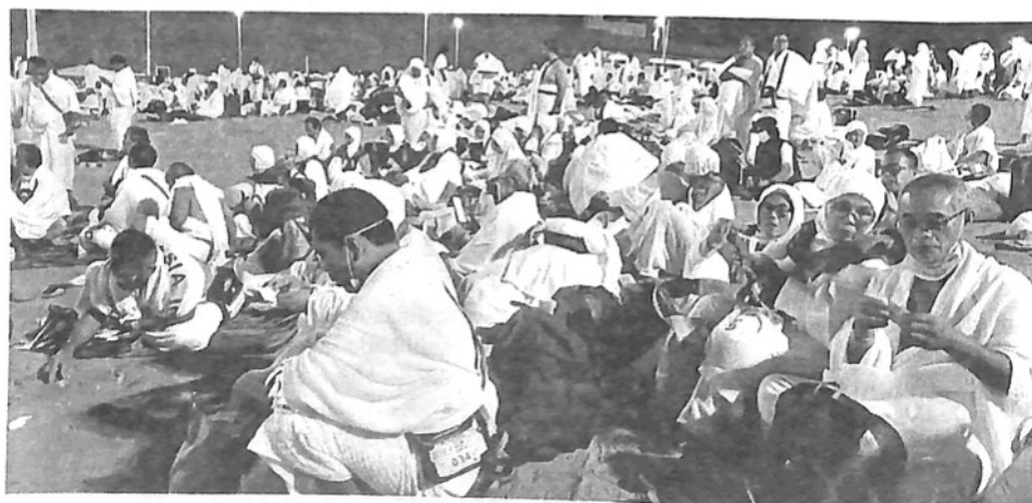
JEMAAH haji asal Padangpanjang di Tanah Suci.

"Untuk air Zamzam sudah sampai di Kemenag. Insyaa Alllah dibagikan kepada jemaah saat kedatangan nanti yang akan difasilitasi PT Pos," terangnya. (sup/*)